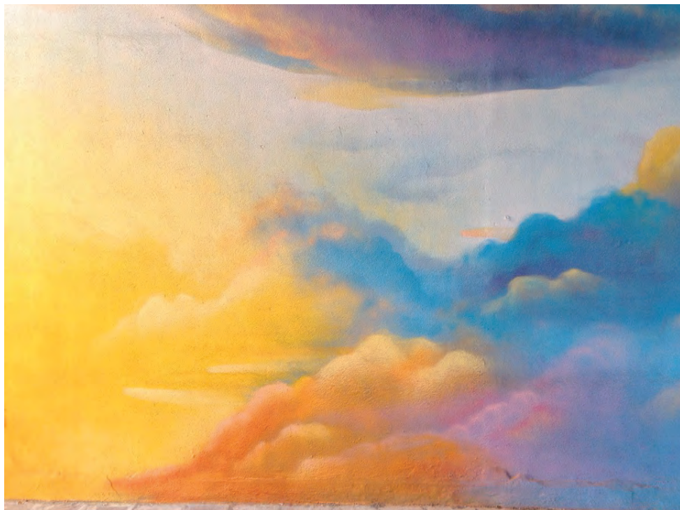
murale di Aerosol Artists